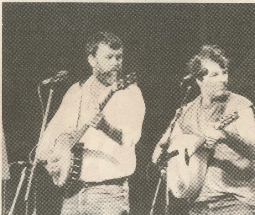
To fra The Houghmagandie Road Show.

Intet nævnt - intet glemt, enhver kan jo selv erhverve sig nogle turistbrochurer. Men skal man forsøge at få alle lækkerierne med på en gang, skal man bestille billetter til den sidste weekend i juni. Værsgo!